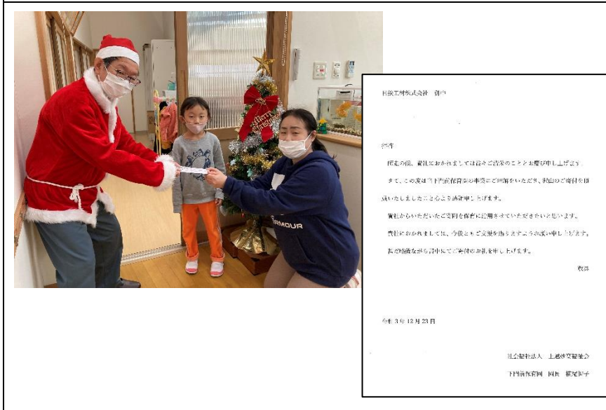
「下門前保育園」に寄付